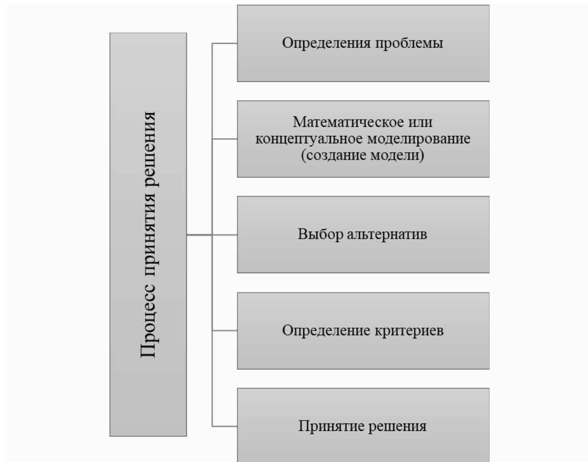
Рис.1. Процесс принятия решения Fig. 1. The decision-making process

Одним из таких инструментов являются системы поддержки принятия решений. Кроме использования методов характерных для теории управления они также основываются на математическом и имитационном моделировании, и является неоспоримыми помощниками руководителя в принятии решений [8]. Процесс принятия решения представлен на рисунке 1.