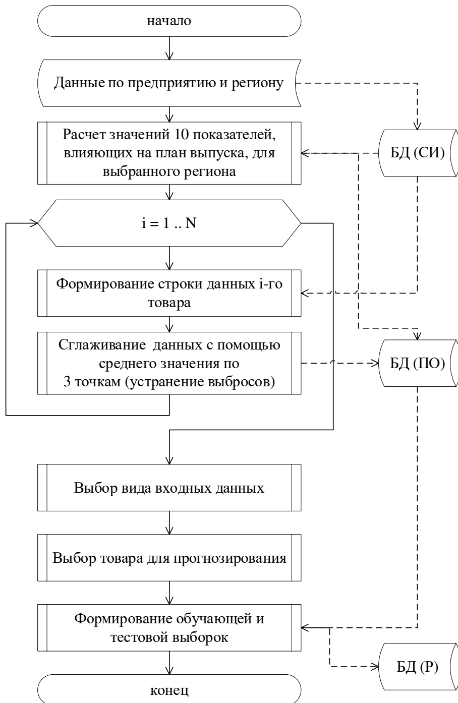
Рис. 3. Алгоритм предобработки данных и формирования блока входной информации для предприятия Fig. 3. Algorithm of data preprocessing and formation of a block of input information for the enterprise

Информационная система включает в себя как потоки данных и информации, так и технические и аппаратные средства. А для организации рабочего места специалиста, входящего в состав информационной системы, используются непосредственно различные информационные технологии, что позволяет проектировать отдельные элементы системы и объединять их в единое целое [7].