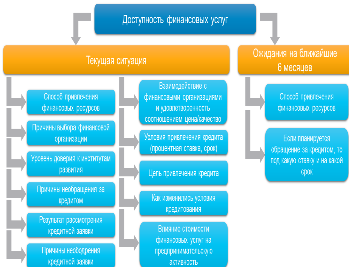
Рис. 1. Структура опроса для предприятий о доступности финансовых услуг в рамках регулярного мониторинга нефинансовых предприятий Fig. 1. The structure of the survey for enterprises on the availability of financial services as part of the regular monitoring of non-financial enterprises