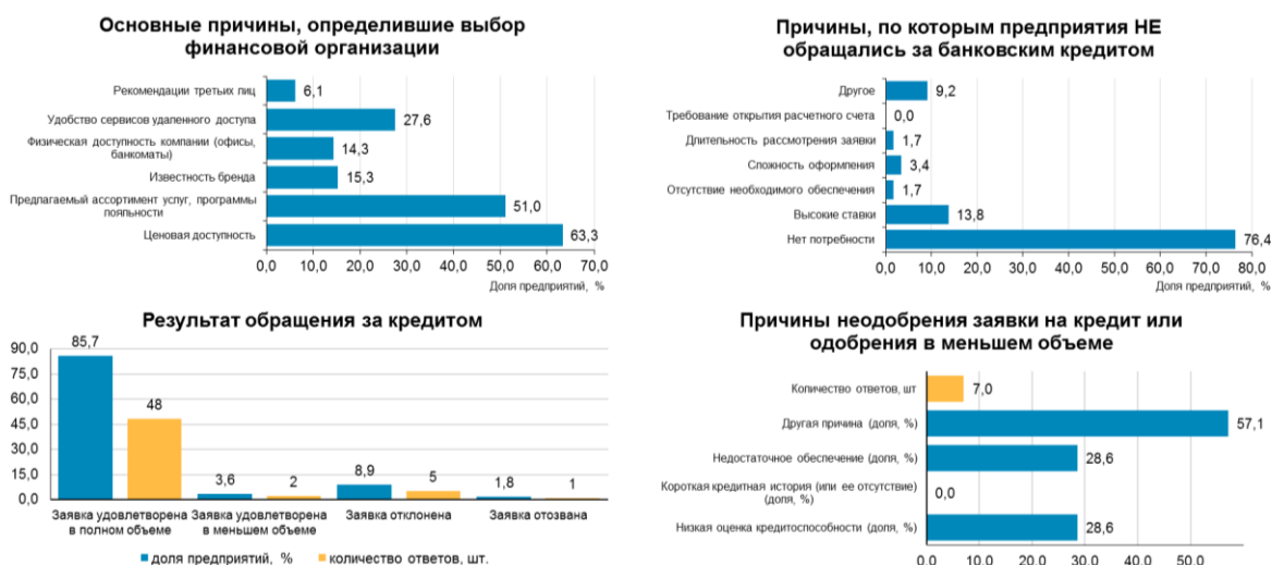
Рис. 3. Характеристика процессов получения финансовых ресурсов в Белгородской области в 1 полугодии 2021 г.

На рис. 3 представлен ряд показателей, которые характеризуют процесс получения опрошенными предприятиями финансовых ресурсов в 1 полугодии 2021 г. с акцентом на банковское кредитование, как основной (после собственных средств) источник финансирования хозяйственной деятельности.