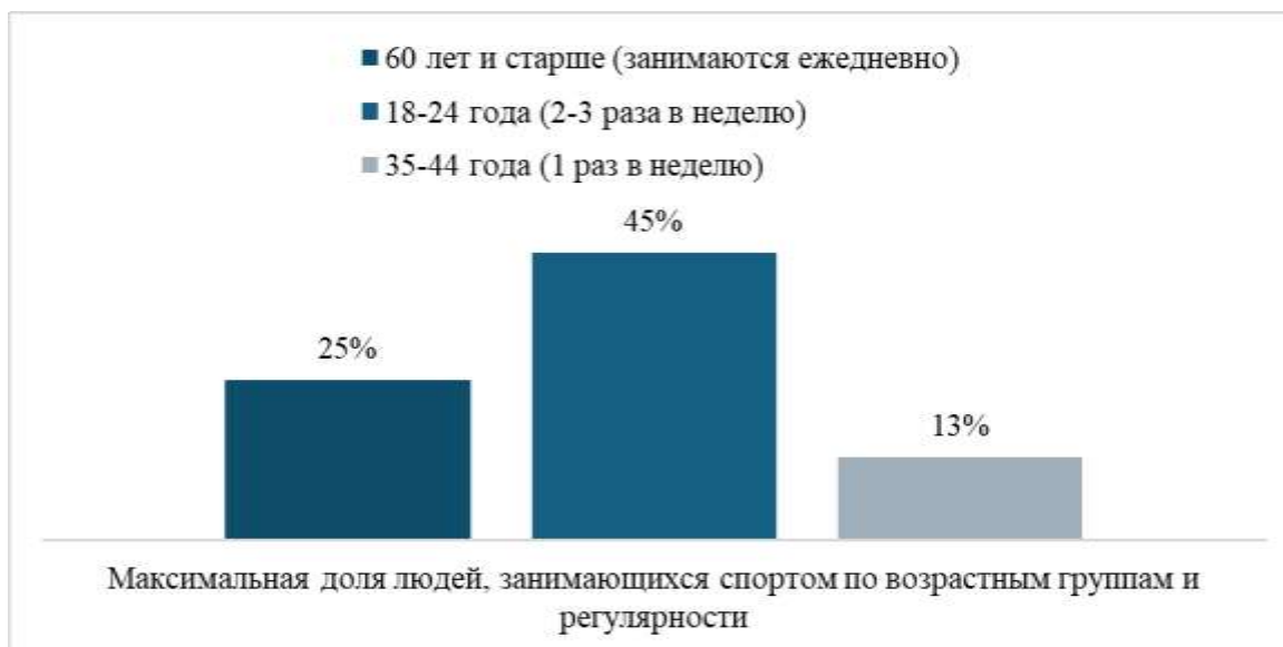
Рис. 1. Статистика занятий спортом в России в 2023 году, % Fig. 1. Sports statistics in Russia in 2023, %