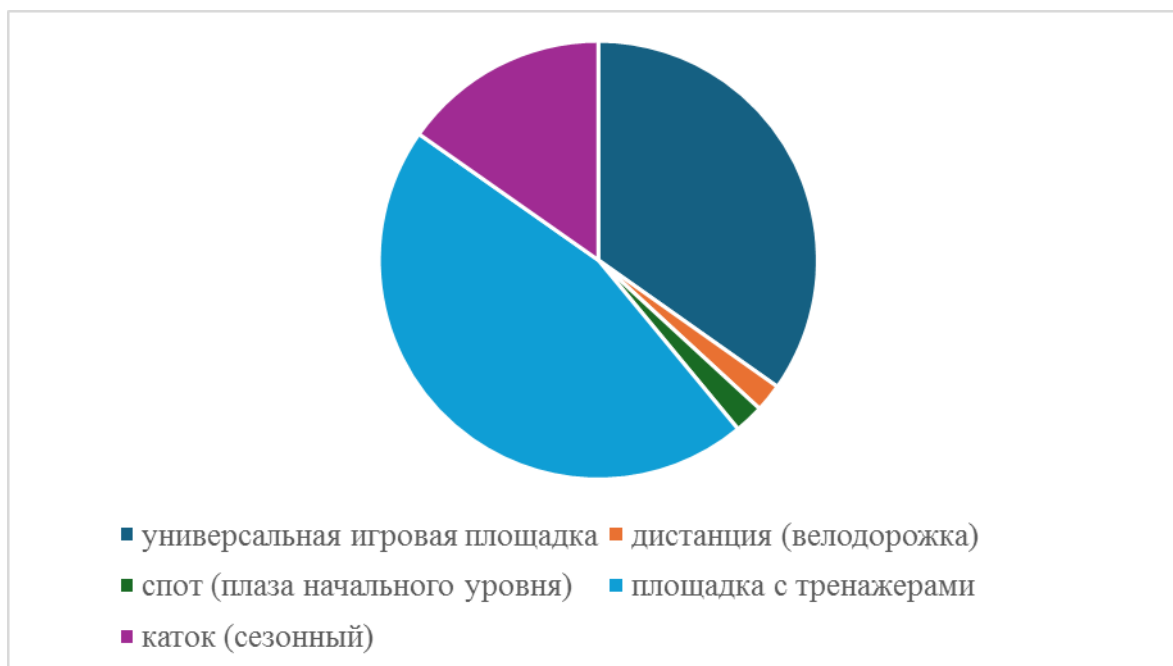
Рис. 3. Структура спортивных объектов городской инфраструктуры Fig. 3. The structure of sports facilities in urban infrastructure

Сегодня к спортивной инфраструктуре отнесено более 45 тысяч объектов городской инфраструктуры (рис. 3). Спортивные площадки во дворах начали появляться, но должны быть те, кто эту работу во дворе будут организовывать.