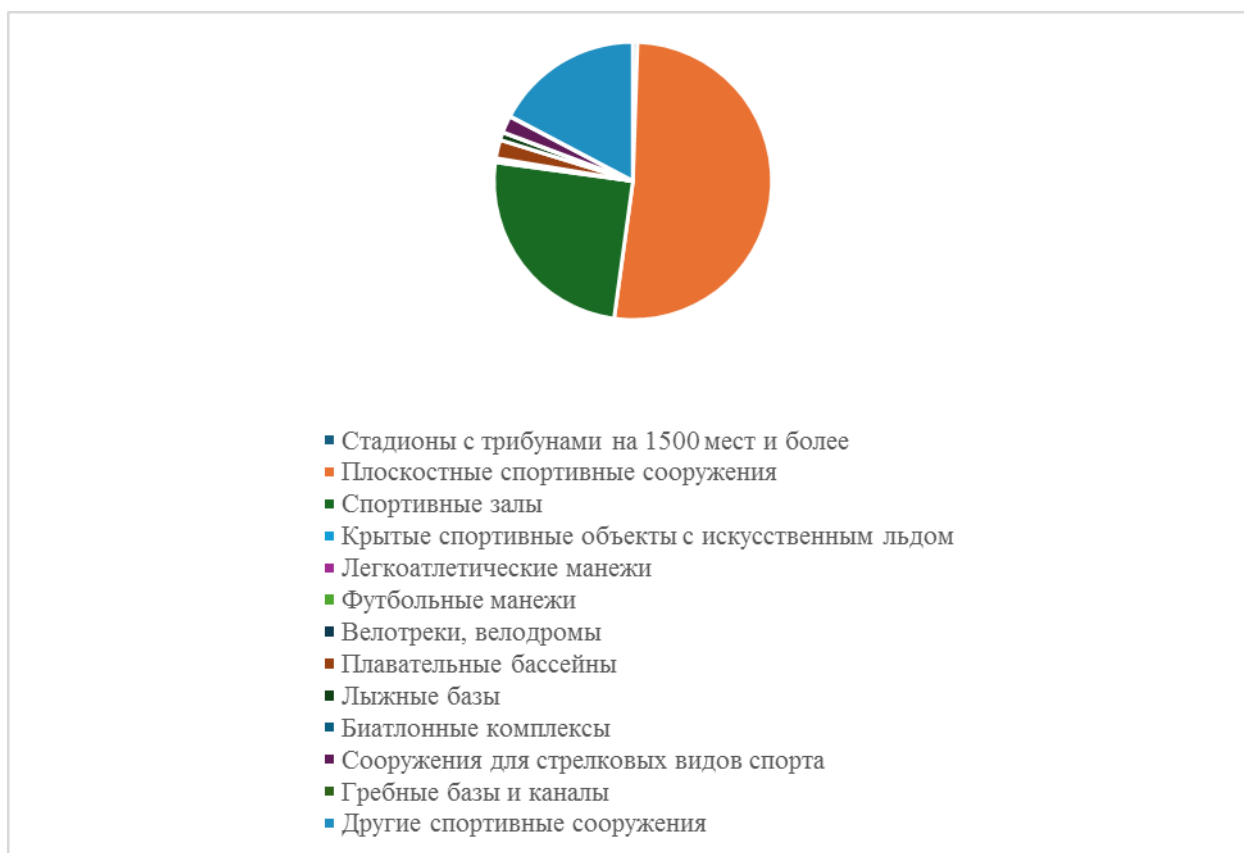
Рис. 2. Структура спортивной инфраструктуры Fig. 2. The structure of the sports infrastructure

В настоящее время по данным Министерства спорта Российской Федерации в нашей стране имеется 353 тысяч объектов спортивной инфраструктуры. Структура спортивной инфраструктуры представлена на рисунке 2.