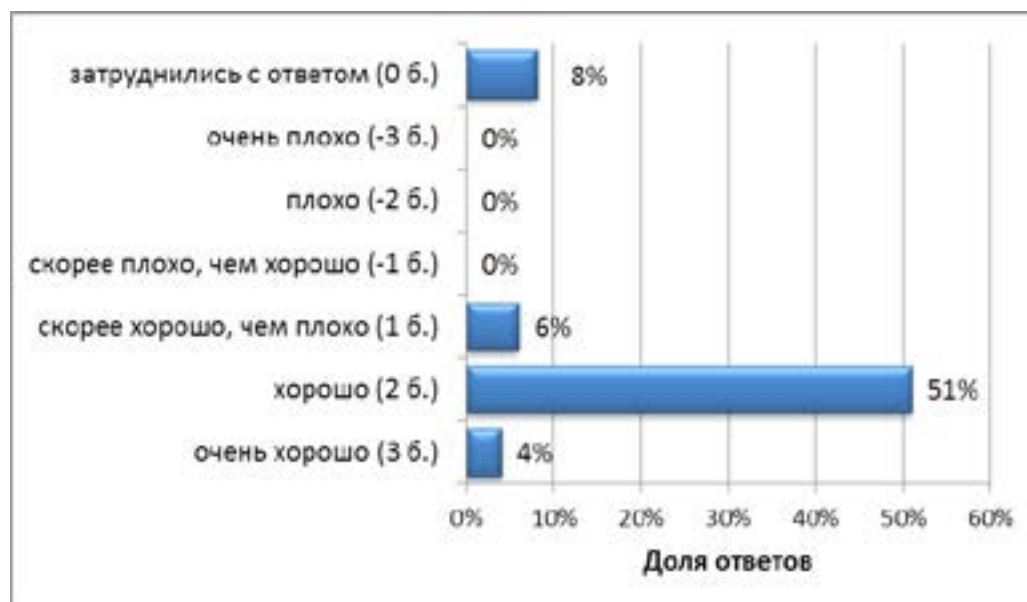
Рис. 3. Оценка формулярной системы в медицинских организациях Омской области (2013; 50 респондентов)

Проведенный нами анализ ответов респондентов показал, что более половины опрошенных оценили формулярную систему, действующую в Омской области, как «хорошую» – 51% руководителей – и «очень хорошую» – 4% (рис. 3).