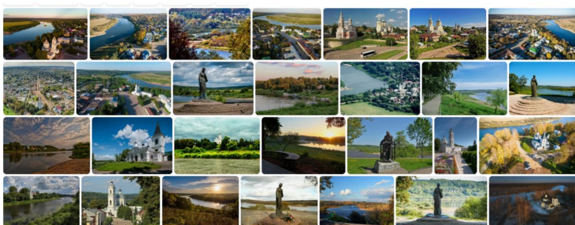
Рис. 3. Примеры фотографий Тарусы, опубликованных в сети Интернет

Образ города формируется в сети Интернет за счет большого количества летних фотографий, где преобладают зеленый и голубой цвета. Набор городских объектов на фото ограничен. При этом присутствует ощущение простора и широты, формируемых за счет панорамной съемки и съемки с квадрокоптера (рис. 3). Зимнего образа города в Интернете практически нет. Такой же визуальный ряд транслируется в официальных СМИ.