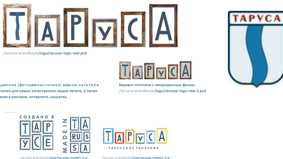
Рис. 4. Примеры рекомендованных в 2018 году логотипов города Fig. 4. Examples of city logos recommended in 2018

Заключение (Conclusions). На основе проведенного анализа информационного поля и сформированного в нем туристического имиджа города Тарусы Калужской области были выявлены коммуникационные проблемы и противоречия, снижающие потенциал развития туристического бренда города Таруса, такие как: отсутствие единого эффективного информационного источника для туристов, отсутствует целенаправленная работа с отзывами, нет четкого понимания, каким же должен быть бренд города, не скорректирована работа с отдельными целевыми аудиториями (молодежь, школьники, работающие граждане до 40 лет), не выстроена системная работа с социальными сетями. Визуальный образ города так же требует коррекции, чтобы привлекать туристов не только в летний сезон. Образ снаружи привлекательнее, чем внутри: тема творчества, писателей и поэтов проявлена в интернете и в СМИ, но не всегда находит отражение в самом городе. Туристы часто не получают того, что ожидают. Положительными сторонами уже существующего имиджа города является сформированное у россиян представление о литературной истории Тарусы, красоте природы, возмож-