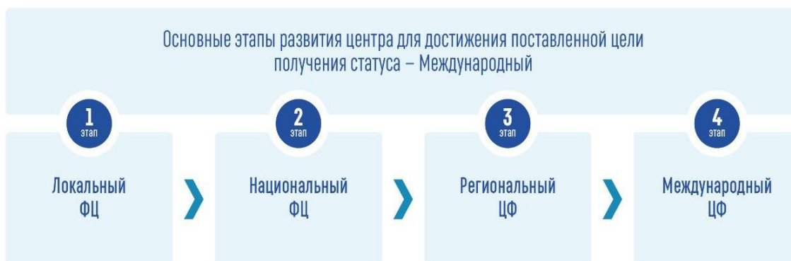
Рис. 1. Методология построения Международного центра финансов Fig. 1. Methodology for building the International Finance Center