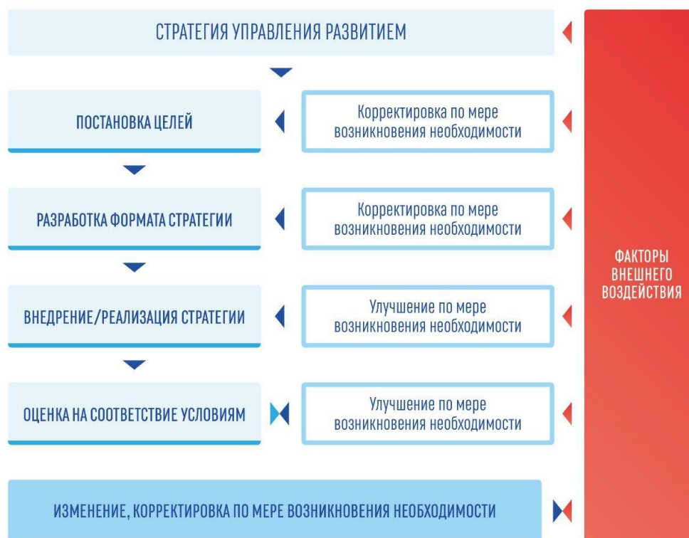
Рис. 3. Стратегия управления поэтапным развитием Fig. 3. Step-by-step management strategy

4) появилась действующая на постоянной основе система обратной связи с участниками рынка [Tiwari, M., Gepp, A., & Kumar, K., 2020].