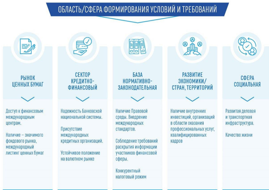
Рис. 4. Сущность организации формирования условий/требований Международного центра финансов

чая техническое, для успешного тиражирования в массы.