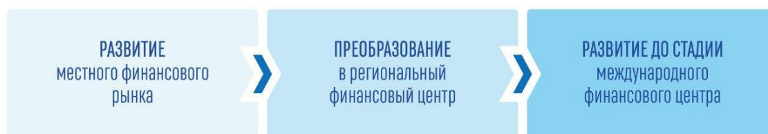
Рис.2. Стадии развития центра финансов до уровня международного финансового центра Fig. 2. Stages of development of the Finance Center to the level of the International Financial Center