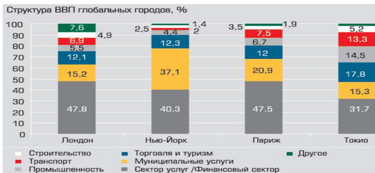
Рис.3. Структура ВВП глобальных городов Fig. 3. GDP structure of global cities

Из представленной на рисунке 3 диаграммы видно, что в структуре ВВП экономики мегаполисов (глобальных городов) наибольший удельный вес составляет также сектор услуг, что непосредственно подтверждает значимость сектора в структуре товарного производства на национальных рынках государств и стран мира.