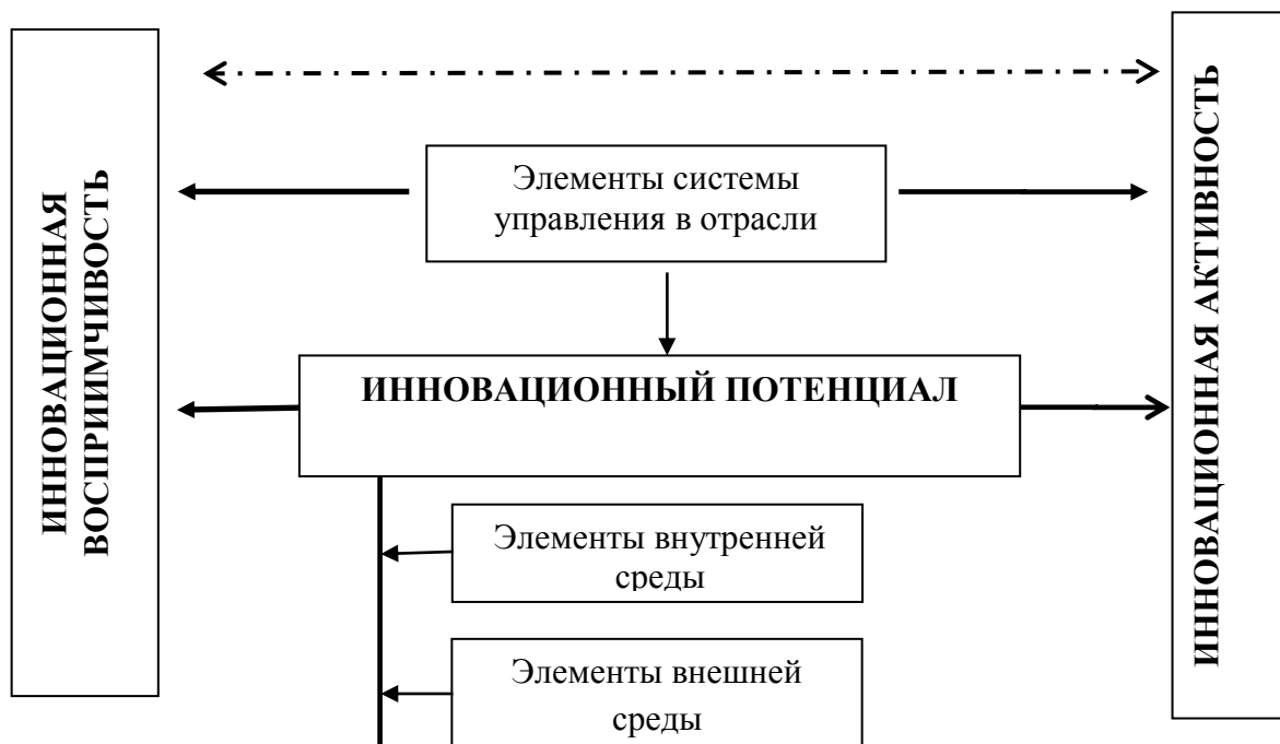
Рис. 3. Инновационная деятельность [составлено автором] Fig. 3. Innovative activity [compiled by the author]

необходимых для осуществления инновационной деятельности. Имея определенный уровень инновационного потенциала необходимо оценивать полученные знания и восприимчивость предприятий отрасли к инновациям (рис. 3).