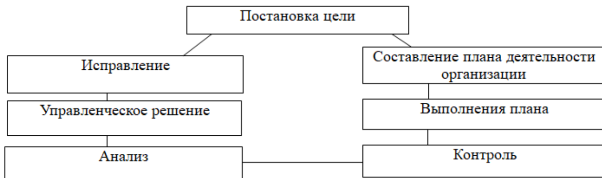
Рис. 1. Цикл управления организацией Fig.1. Organization management cycle

Процесс управления деятельностью сельскохозяйственной организации можно представить в виде следующей схемы (рис. 1).