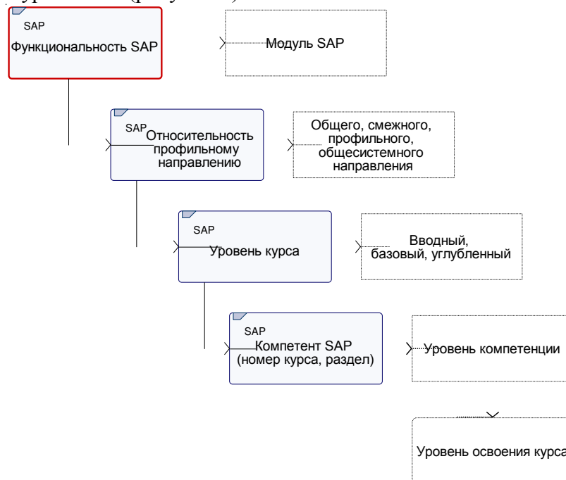
Рис. 3. Классификация уровней курсов SAP Fig. 3. SAP Course Level classification

Компетенции «Функциональность SAP» следует формировать с учётом подхода вендора к классификации уровней курсов SAP (рисунок 3).